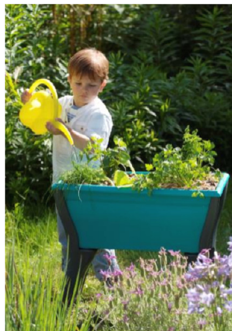
Mon Espace Potager JUNIOR