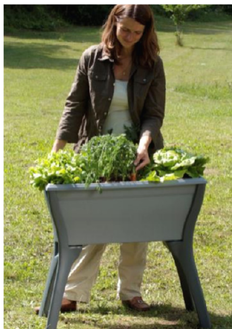
Mon Espace Potager

Jardinez avec vos enfants pour leur apprendre à observer la nature et comprendre son rythme. Ils adoreront mettre les mains dans la terre, manipuler les bulbes et les graines, respirer le parfum d'une fleur ou d'un fruit... avant de le goûter !